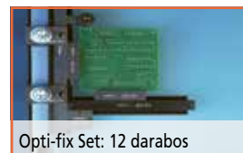
Opti-fix Set: 12 darabos